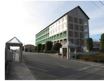
校舎正門入口外観