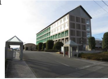
校舎正門入口外観